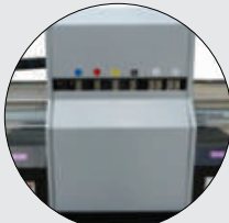
Bireysel Renk Boşaltma