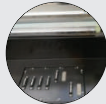
Ph Kapatma Sistemi