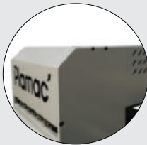
Negatif Basınç Sistemi

Morpho 1212 UV flatbed yazıcı, 15 yılı aşkın teknik araştırma ve geliştirme birikiminin ardından, son derece yüksek hassasiyetteki platform yapısıyla, en güvenilir flatbed baskı çözümüdür. CMYK + Lc + Lm + Beyaz/Vernik seçenekleri ile en iyi fotoğraf kalitesindeki çok çeşitli medya uygulamalarını yerine getiriyor.